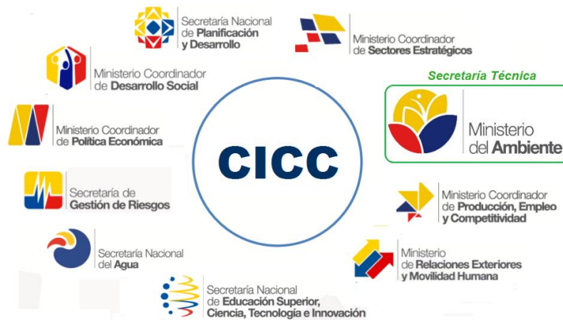
Diagrama 2. Comité Interinstitucional de Cambio climático.